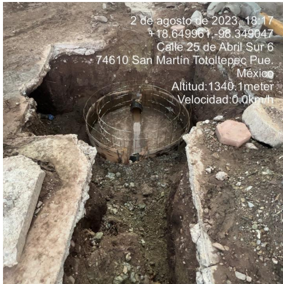
ARMADO DE POZO DE VISITA