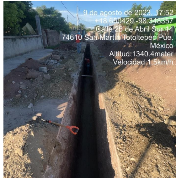
INSTALACIÓN DE TUBERÍA