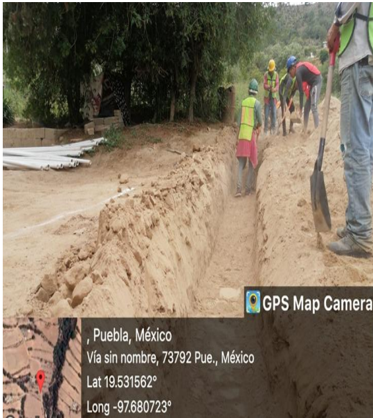
RELLENO COMPACTADO EN CEPA EN RED.