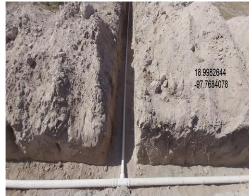
INSTALACIÓN DE PIEZAS ESPECIALES