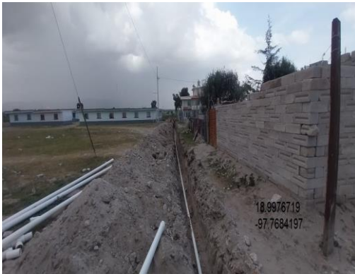
INSTALACIÓN DE TUBERÍA DE PVC CON COPLE