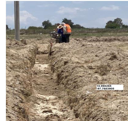
RELLENO EN ZANJAS COMPACTADO