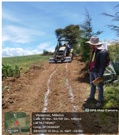
LIMPIEZA Y TRAZO EN ÁREA DE TRABAJO