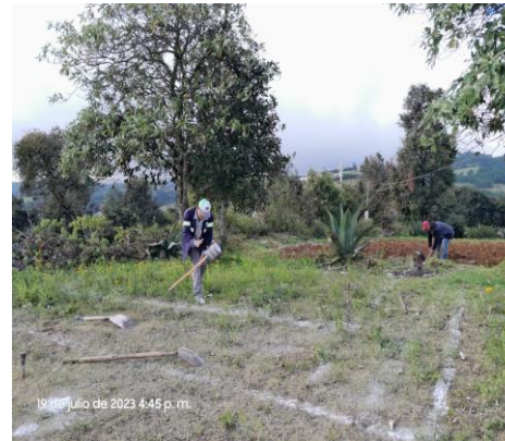
TRAZO Y NIVELACIÓN EN ÁREA DE TRABAJO TANQUE DE ALMACENAMIENTO