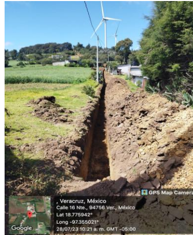
EXCAVACIÓN CON EQUIPO PARA ZANJAS