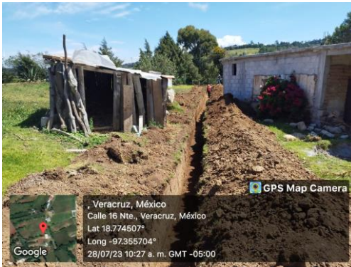
EXCAVACIÓN CON EQUIPO PARA ZANJAS

NOMBRE DE LA OBRA: CONSTRUCCIÓN DEL SISTEMA DE AGUA POTABLE EN EL BARRIO POZO DE PIEDRA, LOCALIDAD DE GUADALUPE FRESNAL, MUNICIPIO DE CAÑADA MORELOS, PUEBLA FOLIO DE OBRA: 230222 NÚMERO DE CONTRATO: OP/LPN-023/CEASPUE-DAJ/2023.21.099.A.N.1 FECHA DE CONTRATO: 27 DE JULIO DE 2023 LOCALIDAD Y MUNICIPIO: DE GUADALUPE FRESNAL, CAÑADA MORELOS, PUEBLA PROGRAMA: PROAGUA 2023