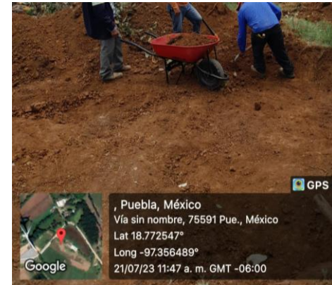
EXCAVACIÓN PARA DESPLANTE DE TANQUE DE ALMACENAMIENTO