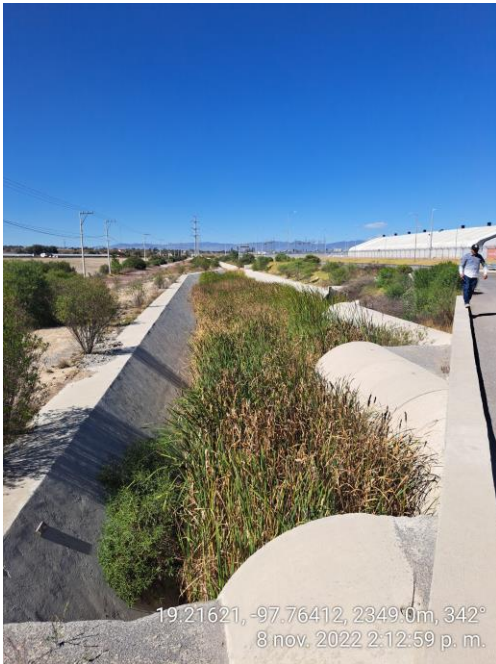
CANAL SATURADO DE MALEZA Y MATERIAL TERROSO