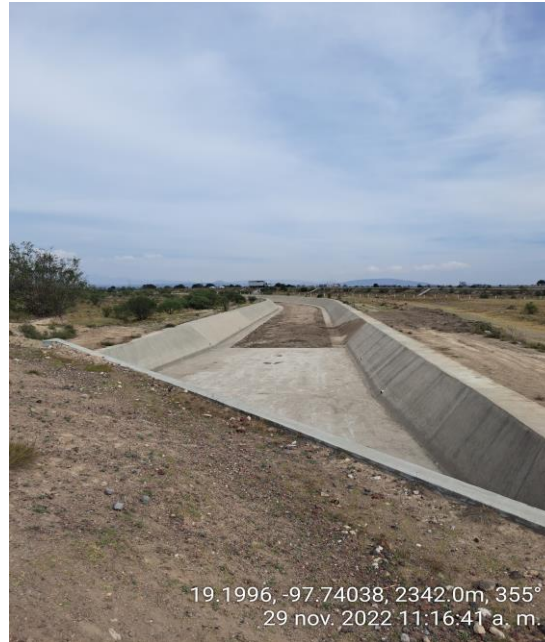
SECCIÓN DE CANAL SIN ESCOMBRO NI MATERIAL VEGETAL