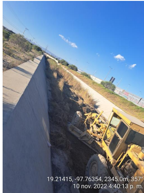
LIMPIEZA CON EQUIPO