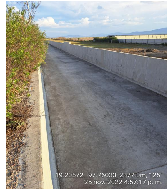
CANAL SIN MATERIAL VEGETATIVO NI ESCOMBRO