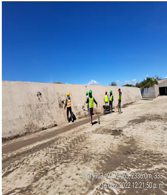
LIMPIEZA DE CANAL CON PERSONAL Y EQUIPO MANUAL